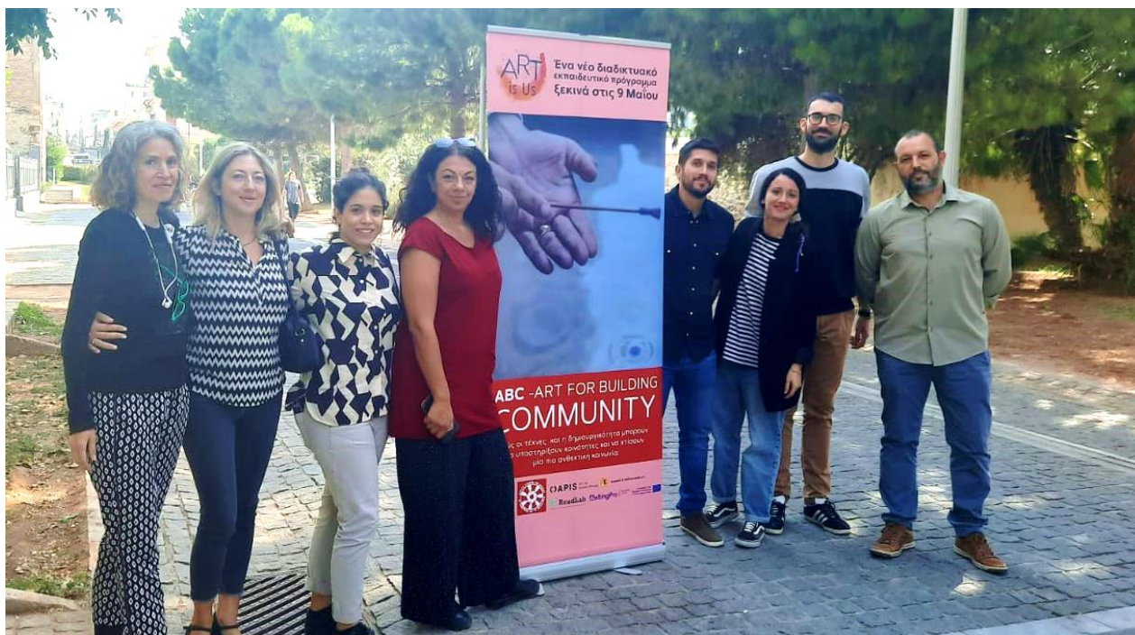
3. mednarodno srečanje partnerjev v Grčiji, Grčija, 11.-12. oktober 2022