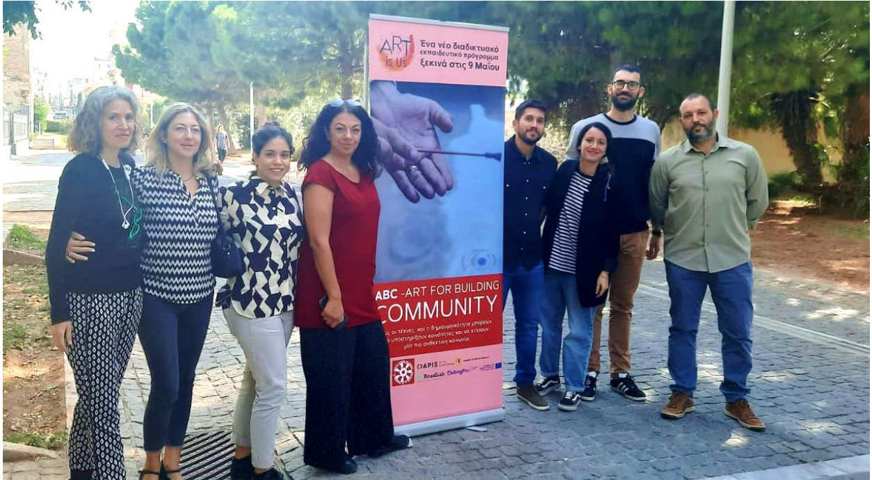
Das 3. transnationale Treffen der Partnerschaft in Athen, Griechenland vom 11. bis 12. Oktober 2022