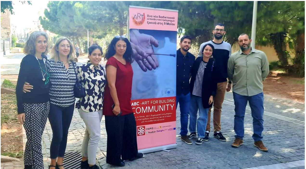
Il 3° incontro transnazionale dei partner si terrà ad Atene, in Grecia, dall'11 al 12 ottobre 2022.

20 mesi dopo l'inizio ufficiale del progetto Art is Us, i partner si sono finalmente incontrati di persona! Il terzo incontro transnazionale dei partner si è svolto questa volta di persona nella città più antica d'Europa, Atene-Grecia, dall'11 al 12 ottobre 2022, ospitato da Art and Action Network, noto come Baloon People.