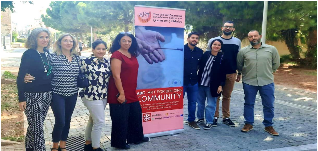
Η 3 η διεθνής συνάντηση εταιρών στην Αθήνα, Ελλάδα, 11-12 Οκτωβρίου 2022