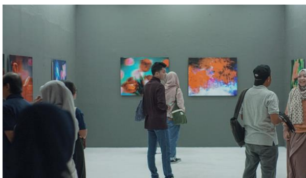
Foto: Kick-off meeting, 28.04 – 05.05.2021

e seguici per conoscere tutte le attività.